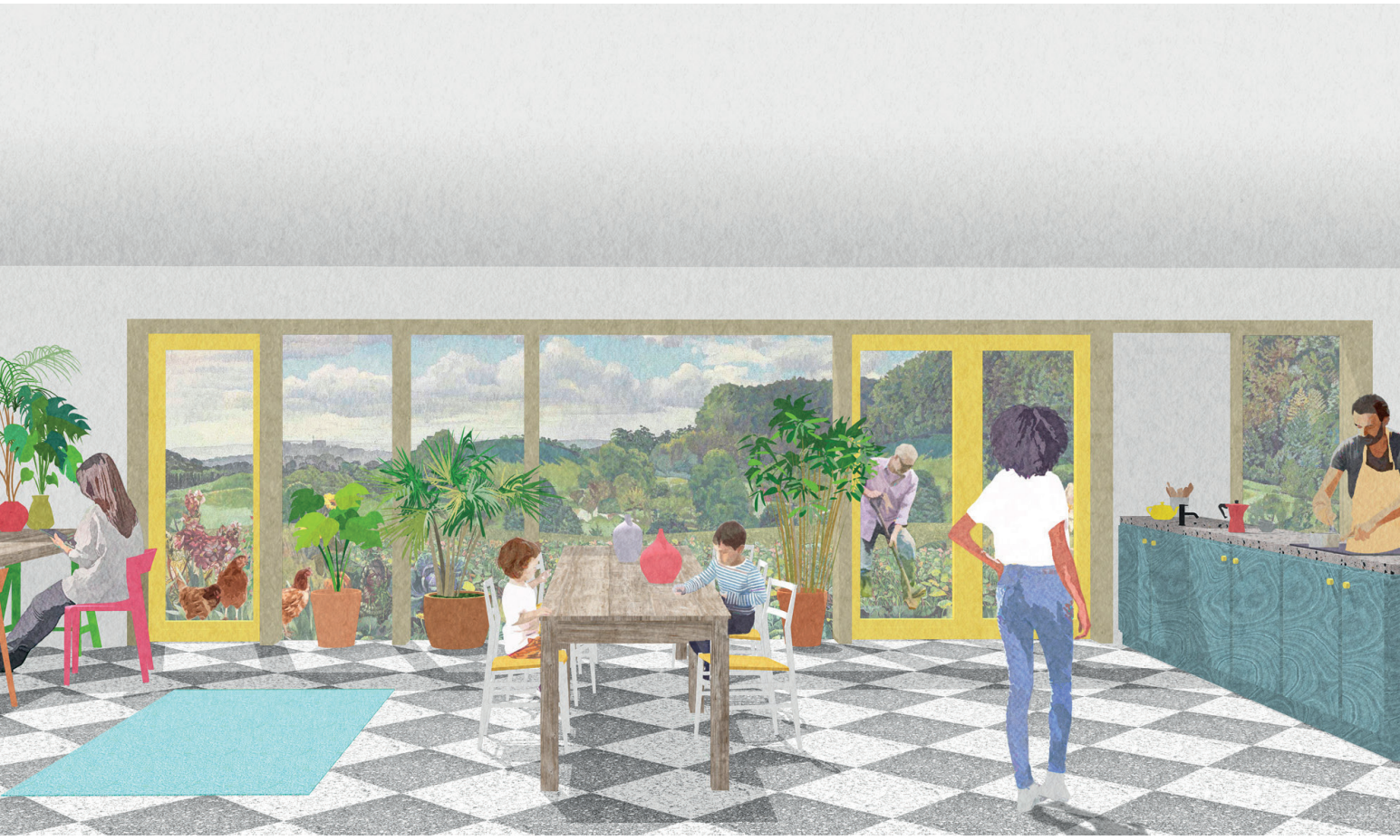
Charles Holland, Co-living in the countryside