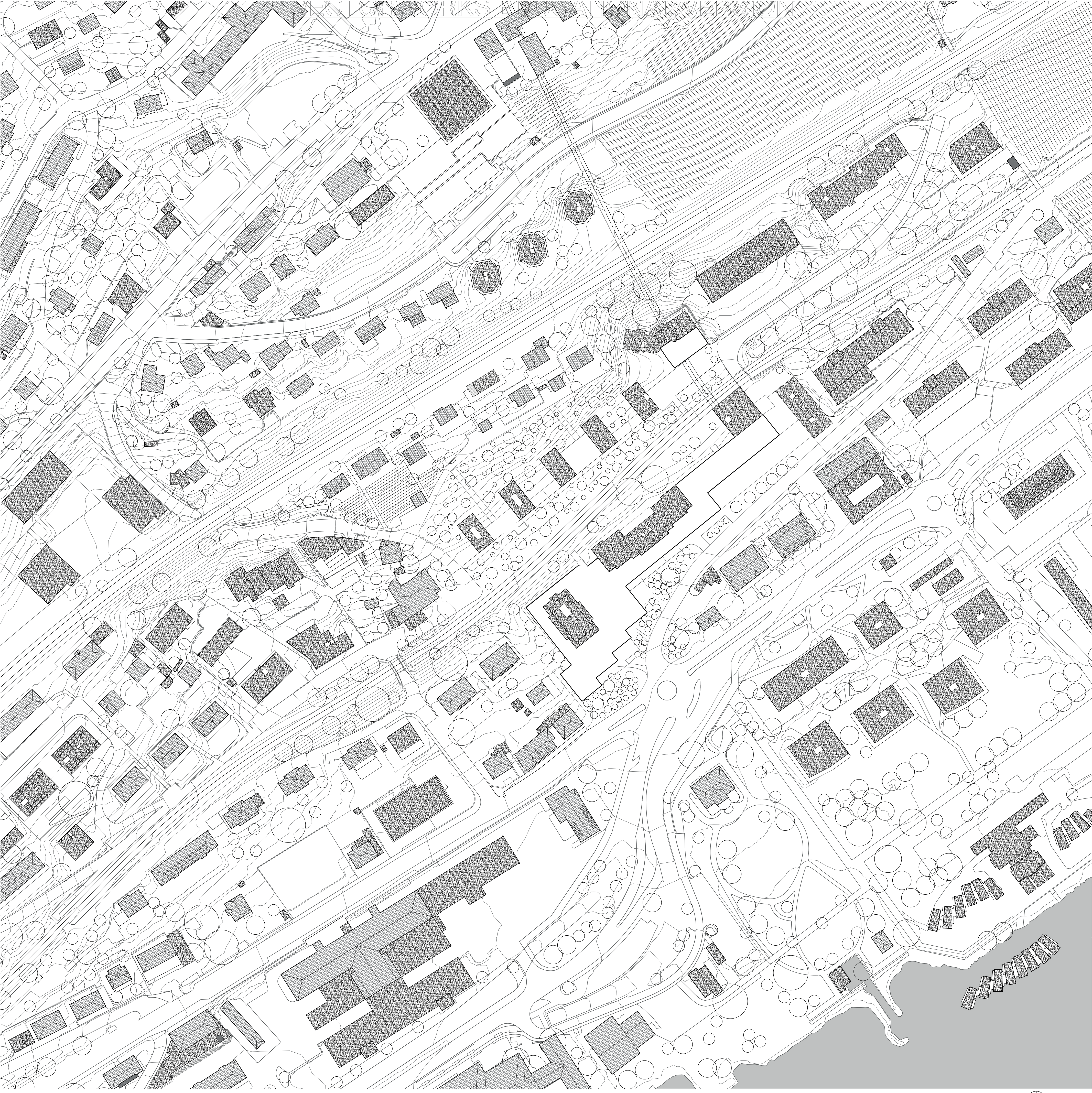
Plan de toiture 1:1'000