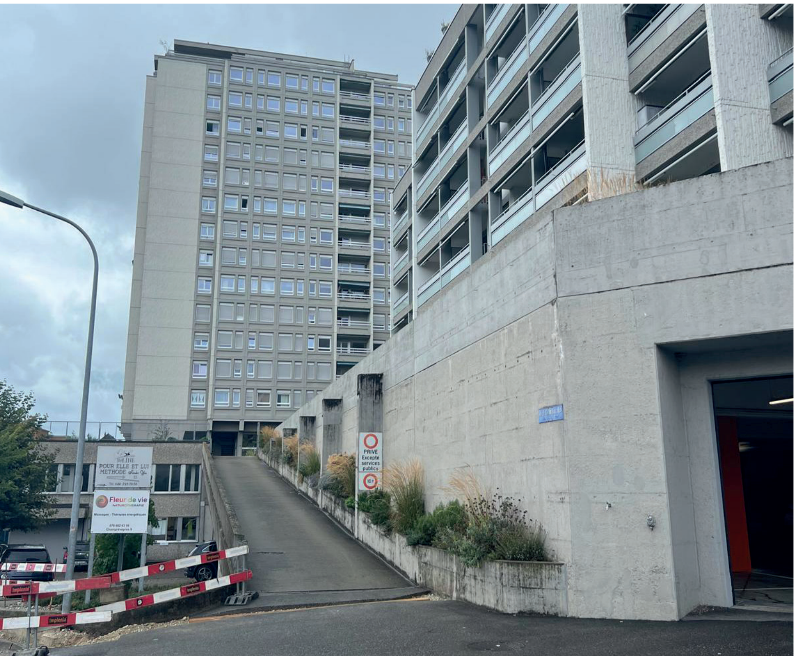
Tour de logement sur socle, rue de champprévèys