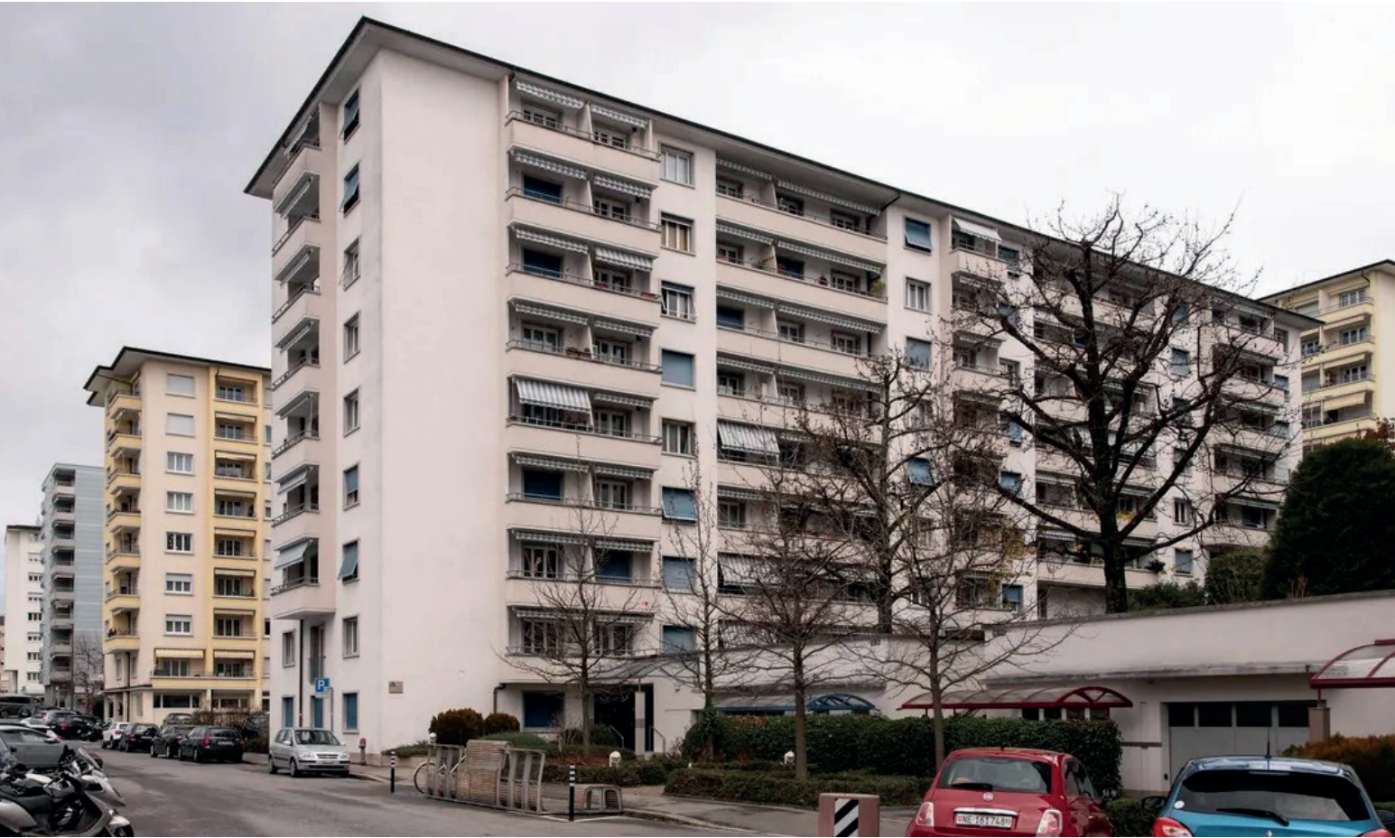
chemin de boisly, lausanne